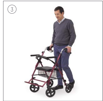
Utilízalo como rollator.