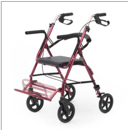
Reposapiés abatible para mayor facilidad y confort al subir y bajar del Rollator.