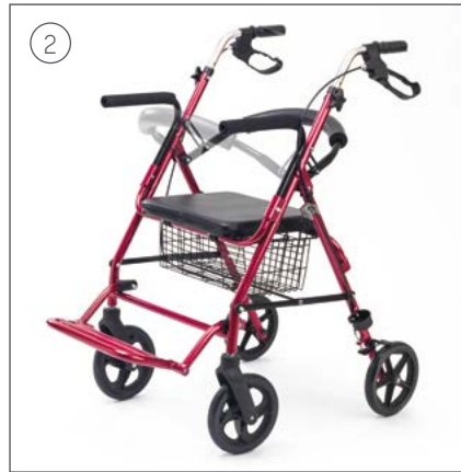
Abate el respaldo.