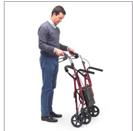
Fácil de plegar para su almacenamiento.