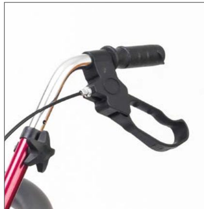
Puños ergonómicos regulables en altura para una mayor comodidad. Freno manual.